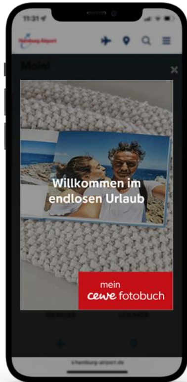
Werbe Pos. 1

Beispiel (Muster / Änderungen und Abweichungen möglich)