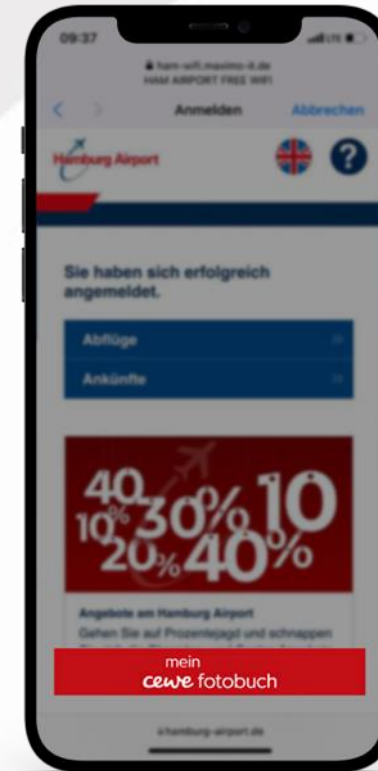
Werbe Pos. 3

Vor dem Log-in Branding oder Video Area (bis zu 10 Sekunden)